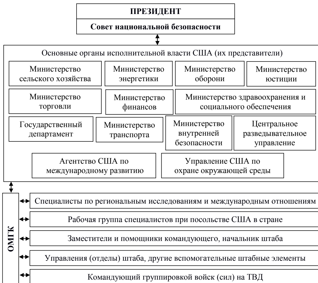
Рис. 2.1. Структура органов исполнительной власти США, принимающих участие в оперативном планировании информационных действий

Важно также отметить, что в целях повышения эффективности таких мероприятий в условиях будущих информационных операций особое внимание следует обращать на более качественную разработку документов оперативного планирования информационных действий вооруженных сил.